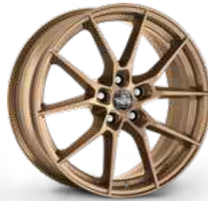
MATT BRONZE BRONZO OPACO