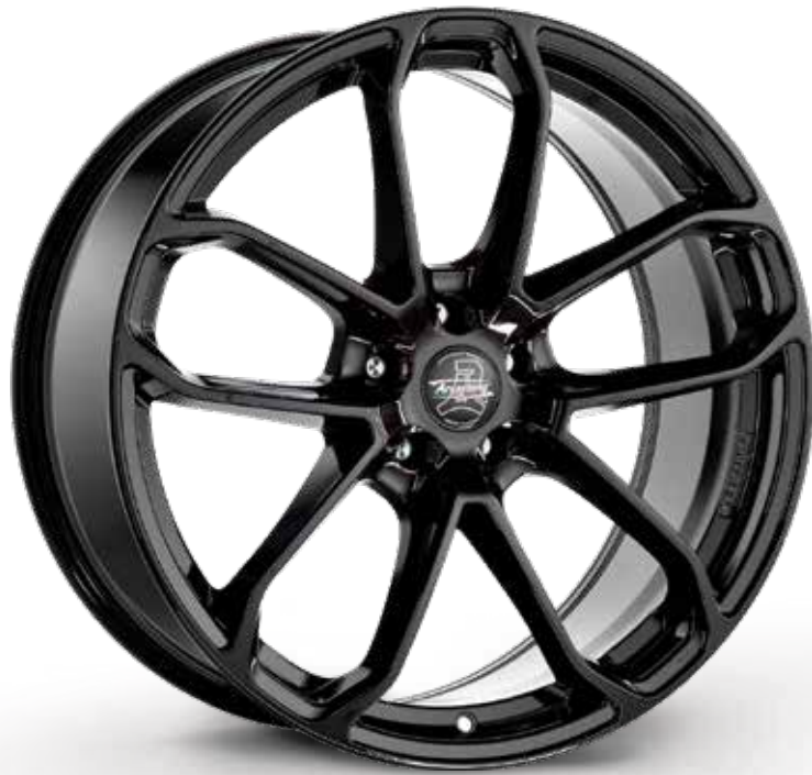
GLOSSY BLACK NERO LUCIDO