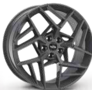
GLOSSY ANTHRACITE ANTRACITE LUCIDO