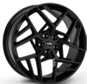
GLOSSY BLACK NERO LUCIDO