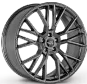
GLOSSY ANTHRACITE ANTRACITE LUCIDO