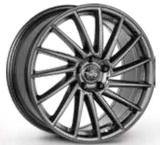
GLOSSY ANTHRACITE ANTRACITE LUCIDO