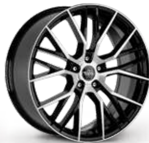
BLACK DIAMOND NERO DIAMANTATO