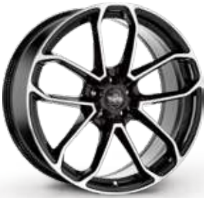
BLACK DIAMOND NERO DIAMANTATO