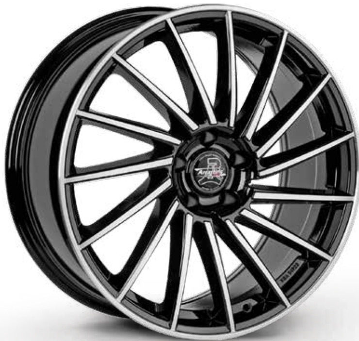
BLACK DIAMOND NERO DIAMANTATO