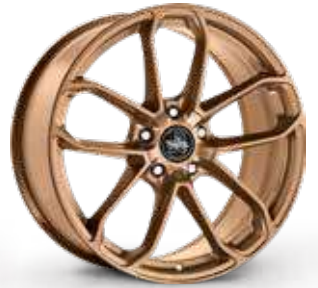
MATT BRONZE BRONZO OPACO