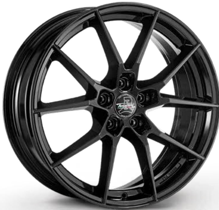
GLOSSY BLACK NERO LUCIDO