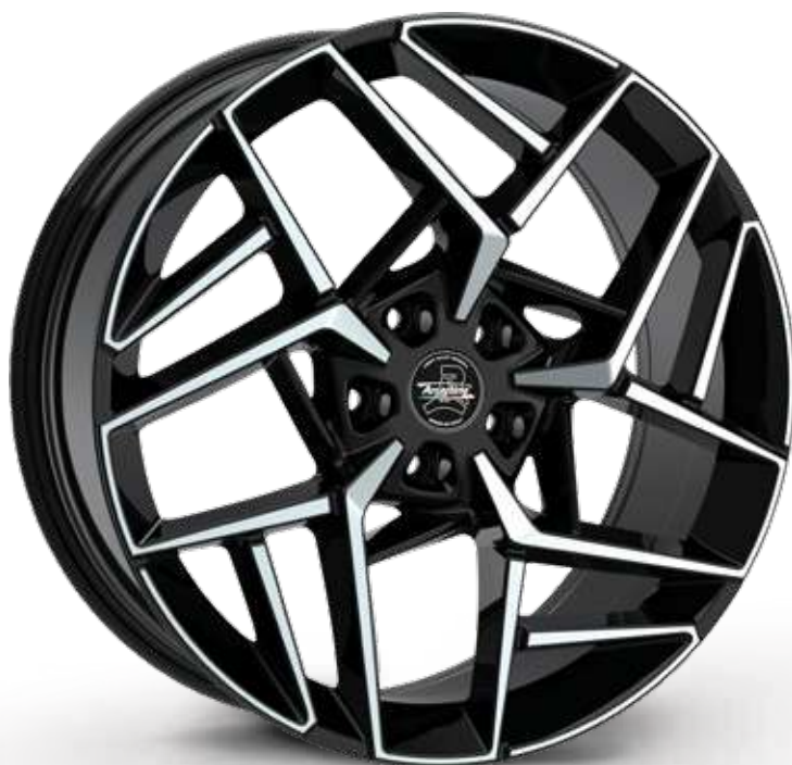
BLACK DIAMOND NERO DIAMANTATO