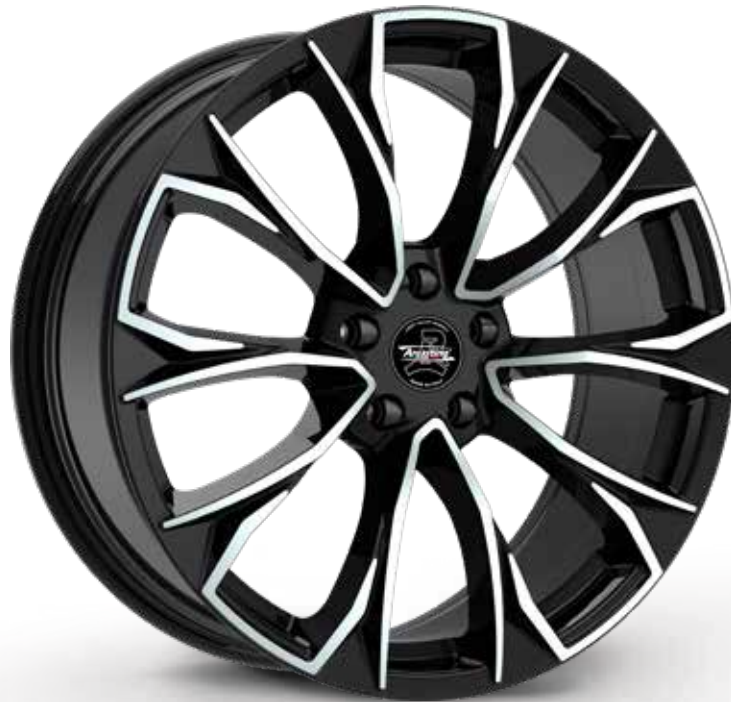
BLACK DIAMOND NERO DIAMANTATO