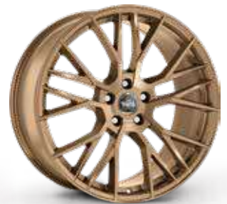
MATT BRONZE BRONZO OPACO