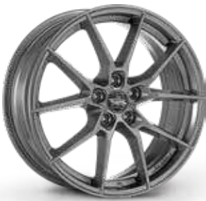
GLOSSY ANTHRACITE ANTRACITE LUCIDO