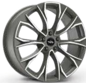
ANTHRACITE DIAMOND ANTRACITE DIAMANTATO