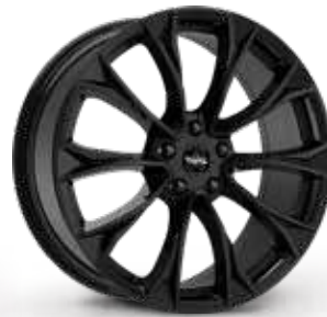
GLOSSY BLACK NERO LUCIDO