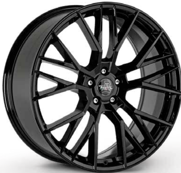
GLOSSY BLACK NERO LUCIDO