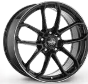
BLACK LIP DIAMOND NERO BORDO DIAMANTATO